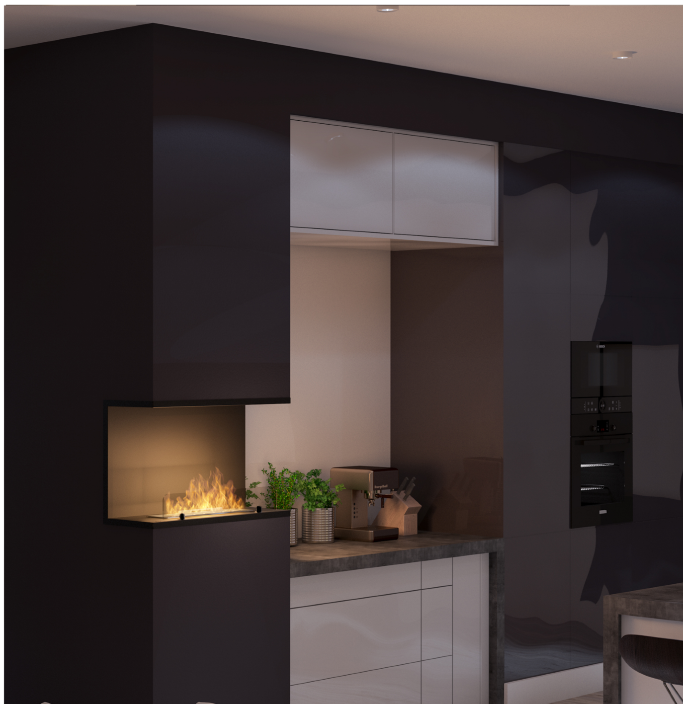
Biokominek Inside C800v2